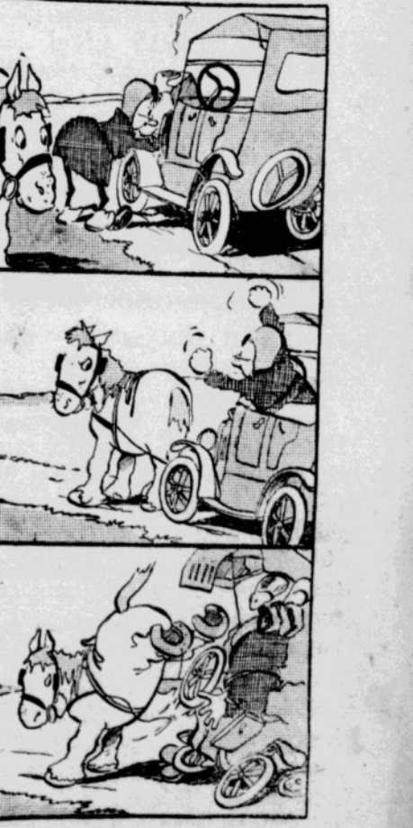
Djangan didekatkan pada mobil. Itu madunja sikuda pedati...

Sjarat2 jang diperlukan untuk sajambara lagu ialah, bahwa lagu tersebut harus bersemangat, ga gah dan berisi djwa kebangsaan. sedang bahasanya hendaklah ber dasarkan pembangunan dan isi da ri pantjasila.