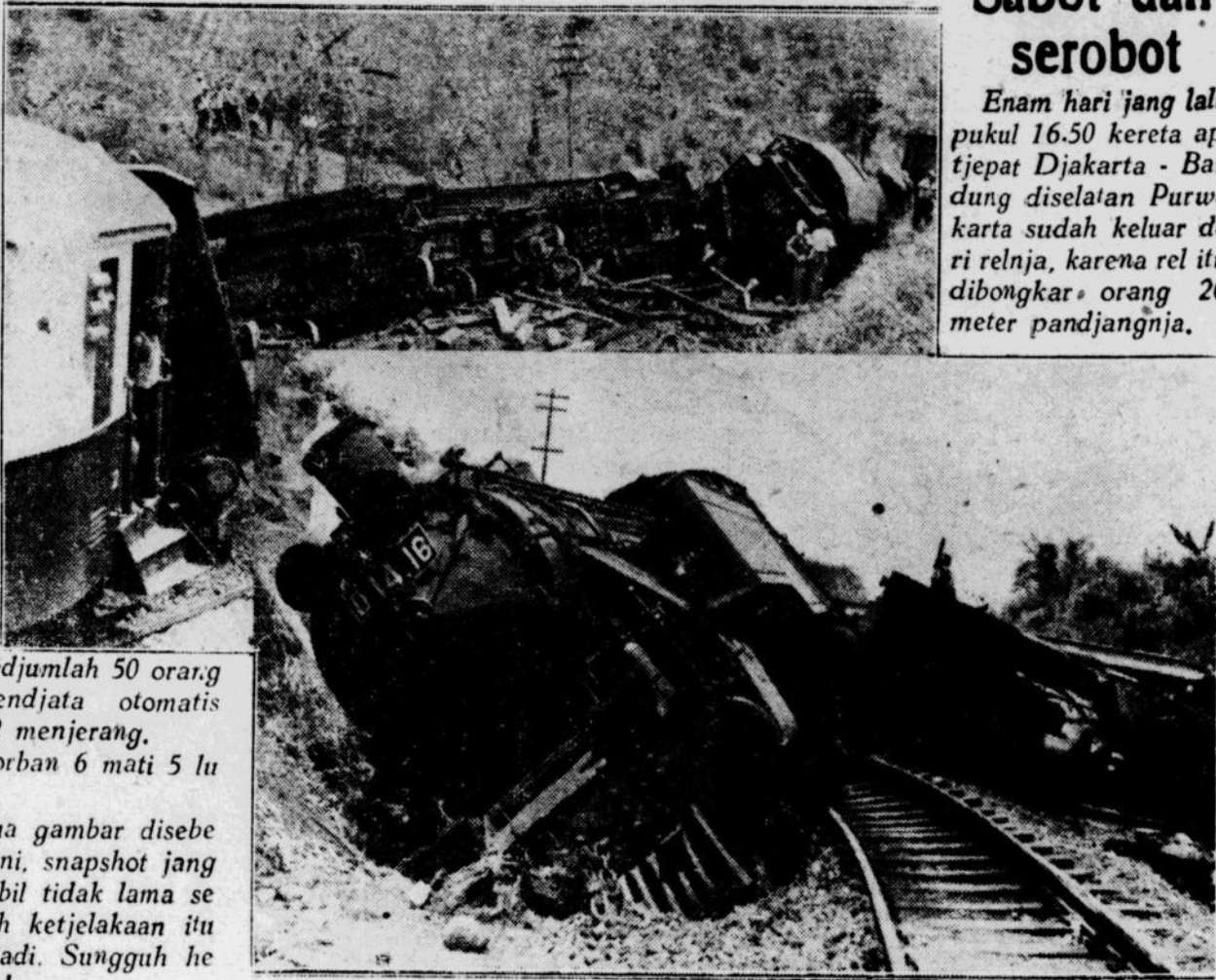
Sedjumlah 50 orang bersendjata otomatis tiba2 menjerang. Korban 6 mati 5 luka. Dua gambar disebelah ini, snapshot yang diambil tidak lama sesudah ketjelakaan itu terjadi. Sungguh hebat!!